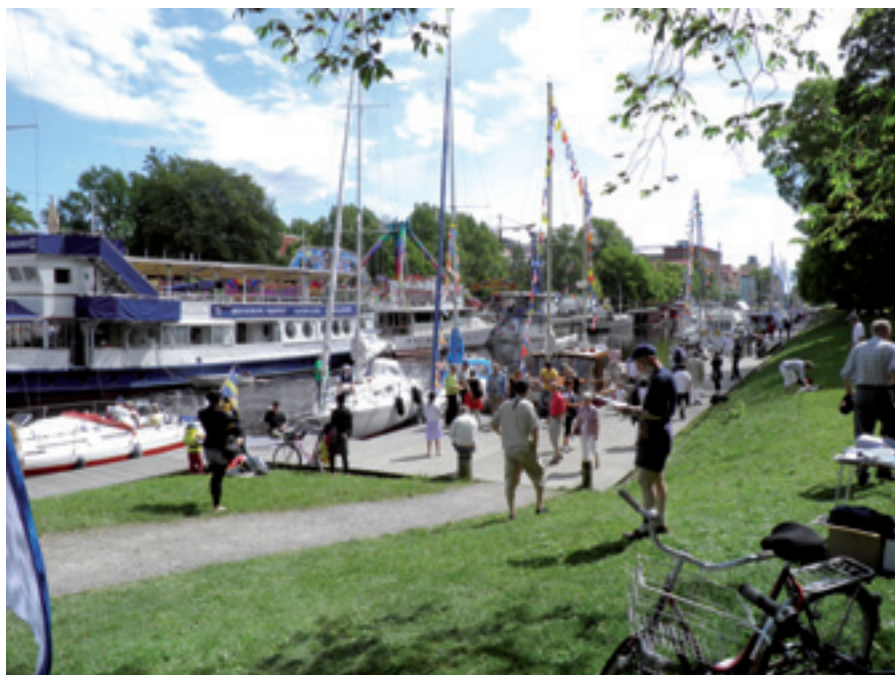
USFS:s Stadseskader våren 2010