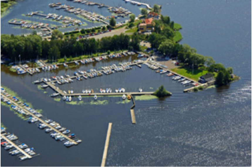
Skarholmen med båtklubbarna Ekolns Segelklubb (ESK) och Uppsala Segel Sällskap (USS)

Handläggande planarkitekt vid Uppsala kommuns Stadsbyggnadskontor har inbjudit till möten i Stadshuset. Vid mötet den 23 augusti presenterade de nya ägarna till Restaurang Skarholmen preliminära övergripande mål för verksamheten.