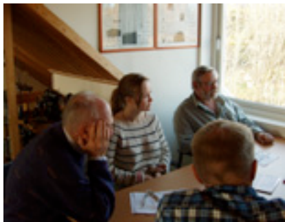
Här pågår grupparbeten om framtidens sjöliv i Uppsala.