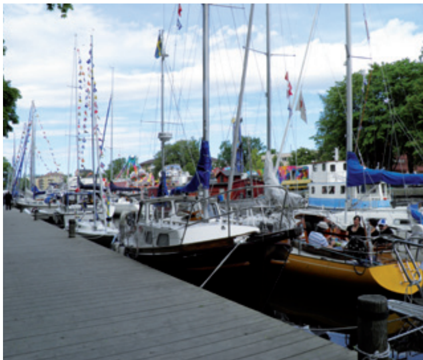
Bild från eskadern 2010.

Eskaderplaneringen startar i januari 2012.